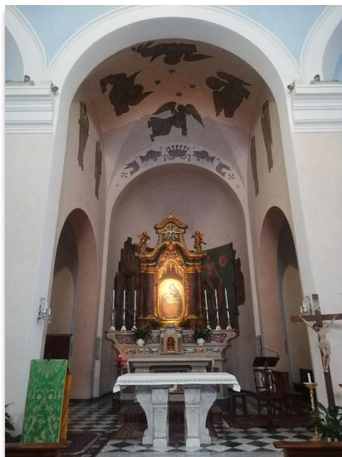
MADONNA DEL TODOCCO PREGA PER NOI